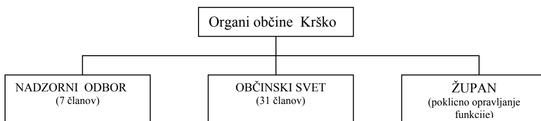
SKICA 1: Organi občine

Župan predstavlja in zastopa občino in je odgovoren za izvrševanje proračuna. Župan Občine Krško Danilo Sitar je v obdobju 1.1.1995—16.12.1998 opravljal funkcijo poklicno. Od 17.12.1998 opravlja funkcijo župana Franci Bogovič.