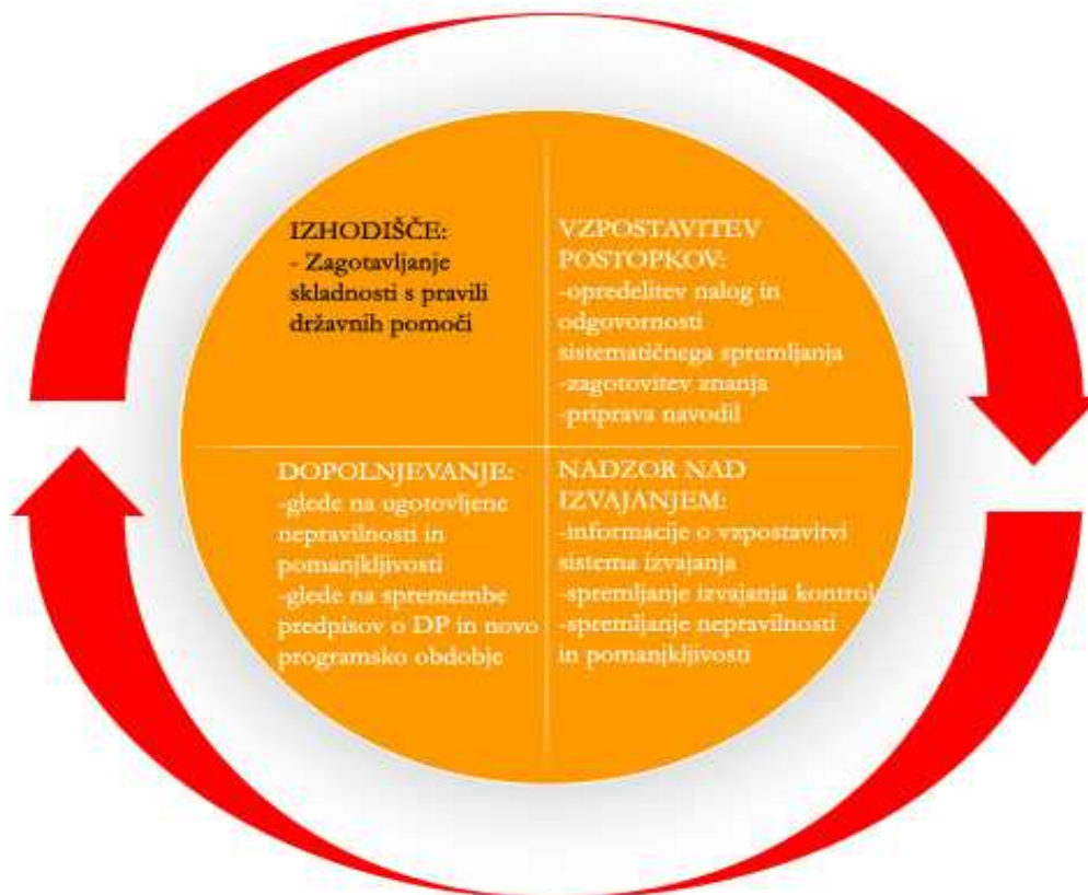
Slika 4: Model PDCA, z vključenimi področji ocenjevanja