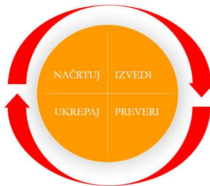
Slika 3: Model PDCA