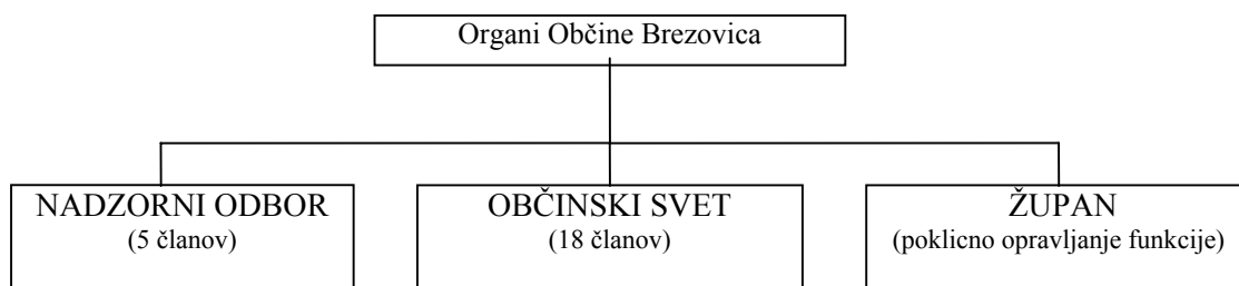
SKICA 1: Organi občine

Občinska uprava je organizirana enovito. V upravi je sistemiziranih 12 delovnih mest, od tega jih je bilo po stanju na dan 30.9.2000 zasedenih 7. Po podatkih računskega sodišča imajo majhne občine (od 5.001 do 10.000 prebivalcev) povprečno 9 zaposlenih v občinski upravi.