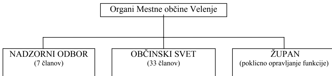
SKICA 1: Organi občine

V občinski upravi je sistemiziranih 87 delovnih mest 5 , od tega jih je bilo po stanju na dan 1.9.2001 zasedenih 64.