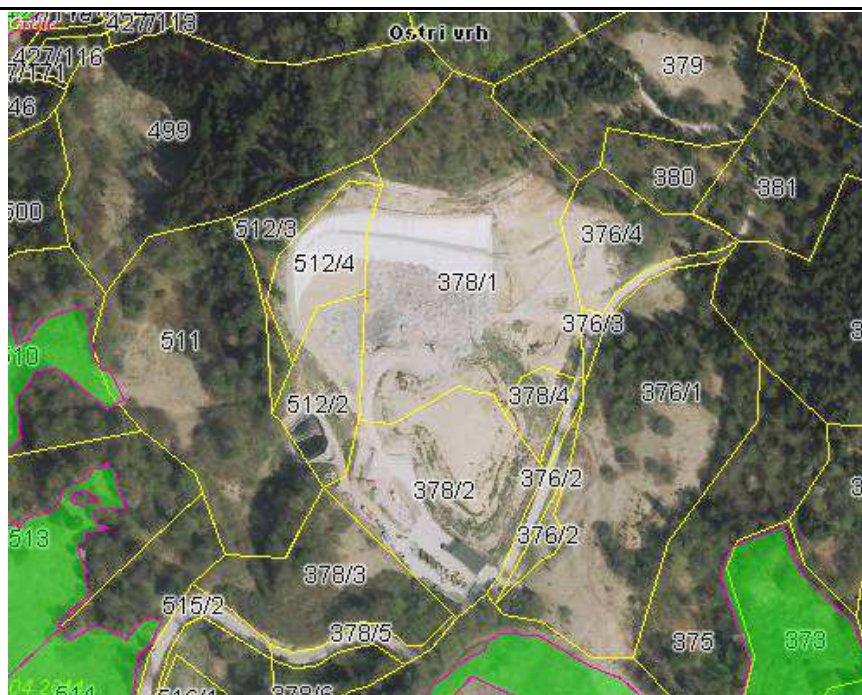
Slika 2: Odlagališče nenevarnih odpadkov Ostri vrh po izvedeni razširitvi