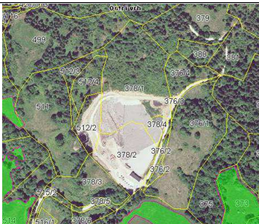
Slika 1: Odlagališče nenevarnih odpadkov Ostri vrh pred razširitvijo