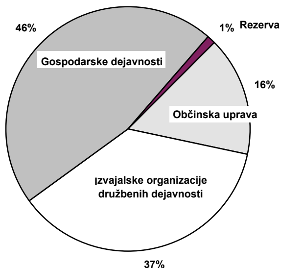
Struktura posameznih skupin odhodkov za leto 1996

V strukturi odhodkov so v obeh letih stabilni deleži na naslednjih področjih: dejavnost občinske uprave in organov občine, kulture, sociale, zdravstva, požarne varnosti, javnih del, drobnega gospodarstva in turizma.